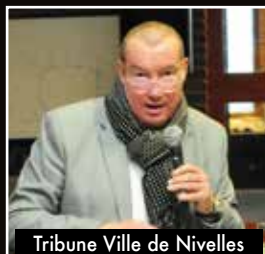
Tribune Ville de Nivelles